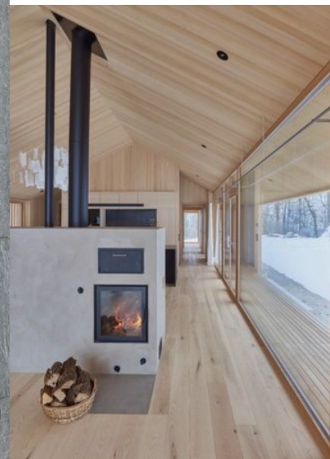
Romotop Cara C oz Kleberstein fra Seljordvarme